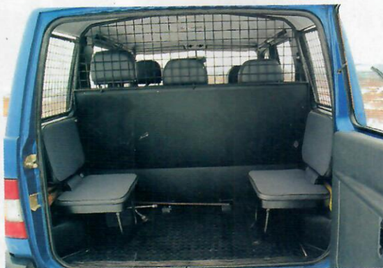
Mřížkou oddělený zavazadlový prostor s nouzovými sedačkami